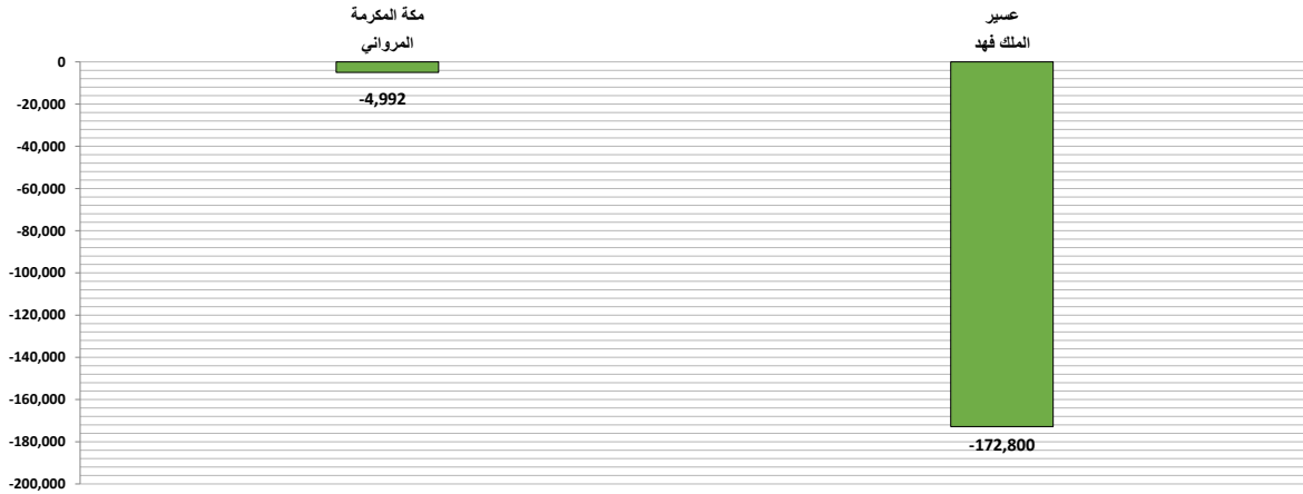
حجم المياه المنصرفة من بوابات السدود (م ٣ ) بين يومي السبت ٢٠٢٢/٠٢/١٩ م و الأحد ٢٠٢٢/٠٢/٢٠ م