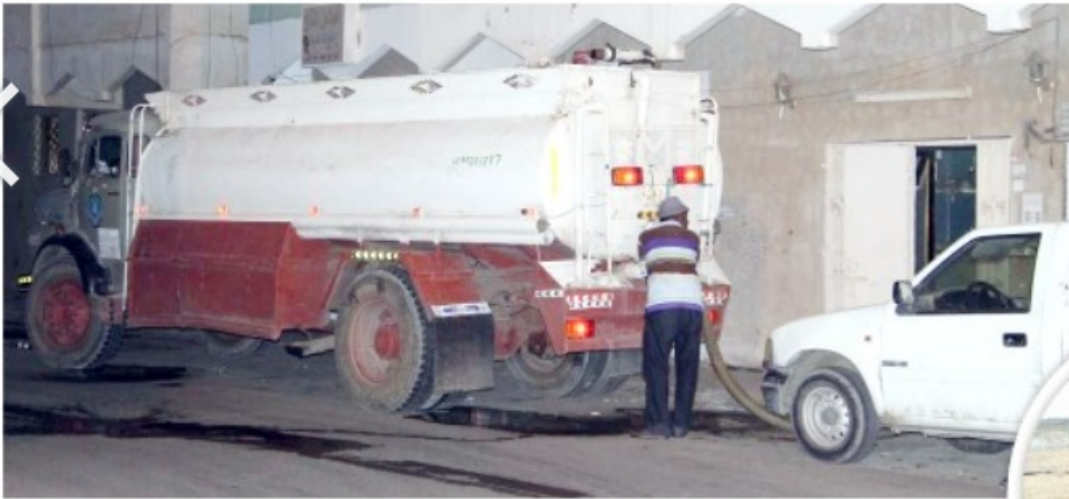
تعبئة خزان مياه من صهريج تم شراؤه.