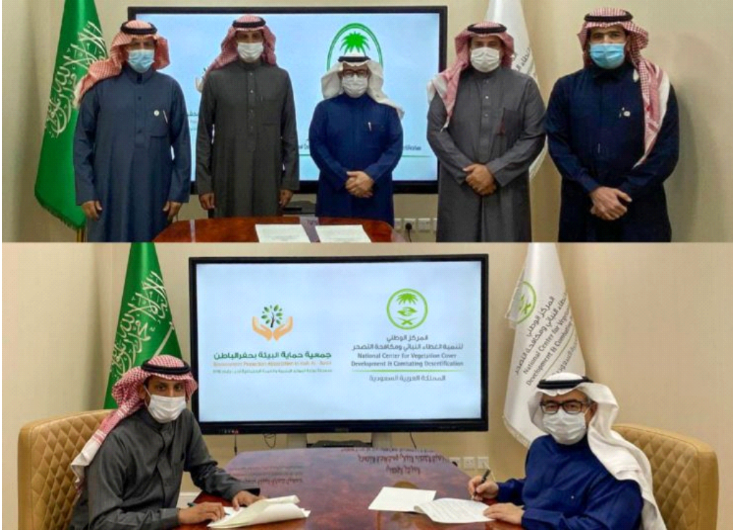
جمعية حماية البيئة