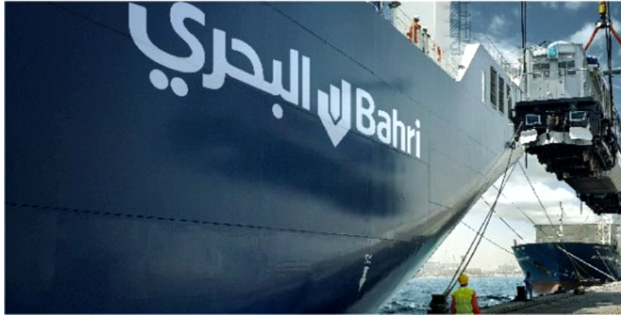
إحدى ناقلات الشركة الوطنية السعودية للنقل البحري "البحري"