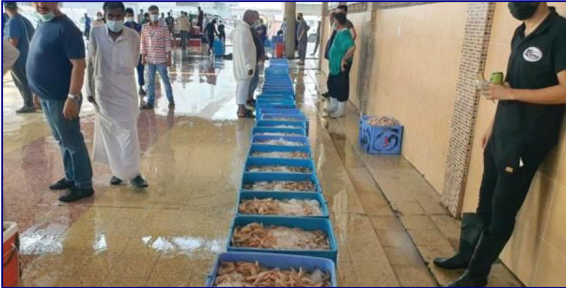
40 % زيادة بالروبيان.. والجامبو يلامس 2300 ريال