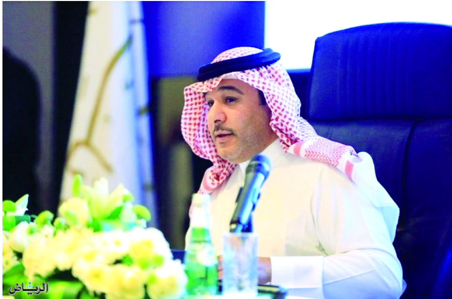
فهد بن حثلين