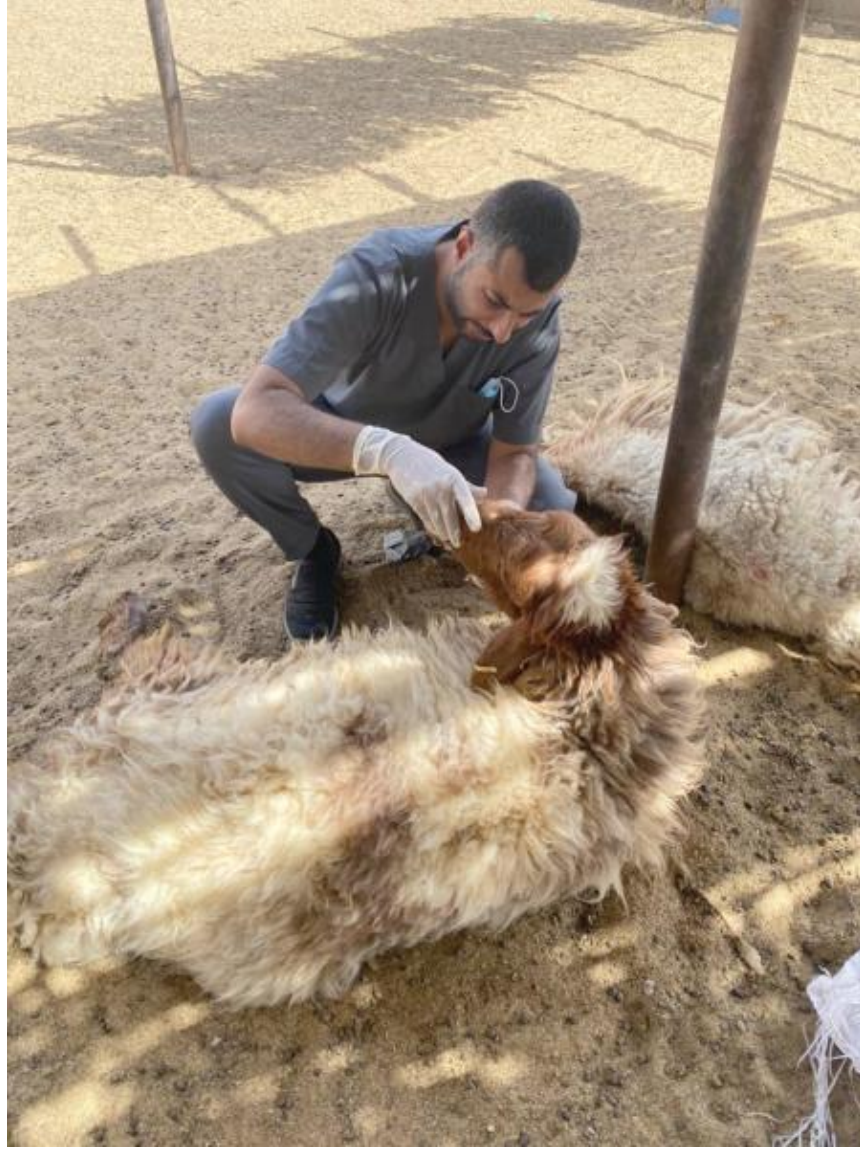
رعاية بيطرية للأغنام المصابة