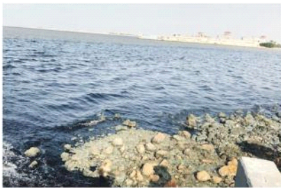
تلوث الغريبة لفتت انتباهات واسعة من مياه الساحل

تحاليل مخبرية تجزم بمعرفة حقيقة المادة الغريبة