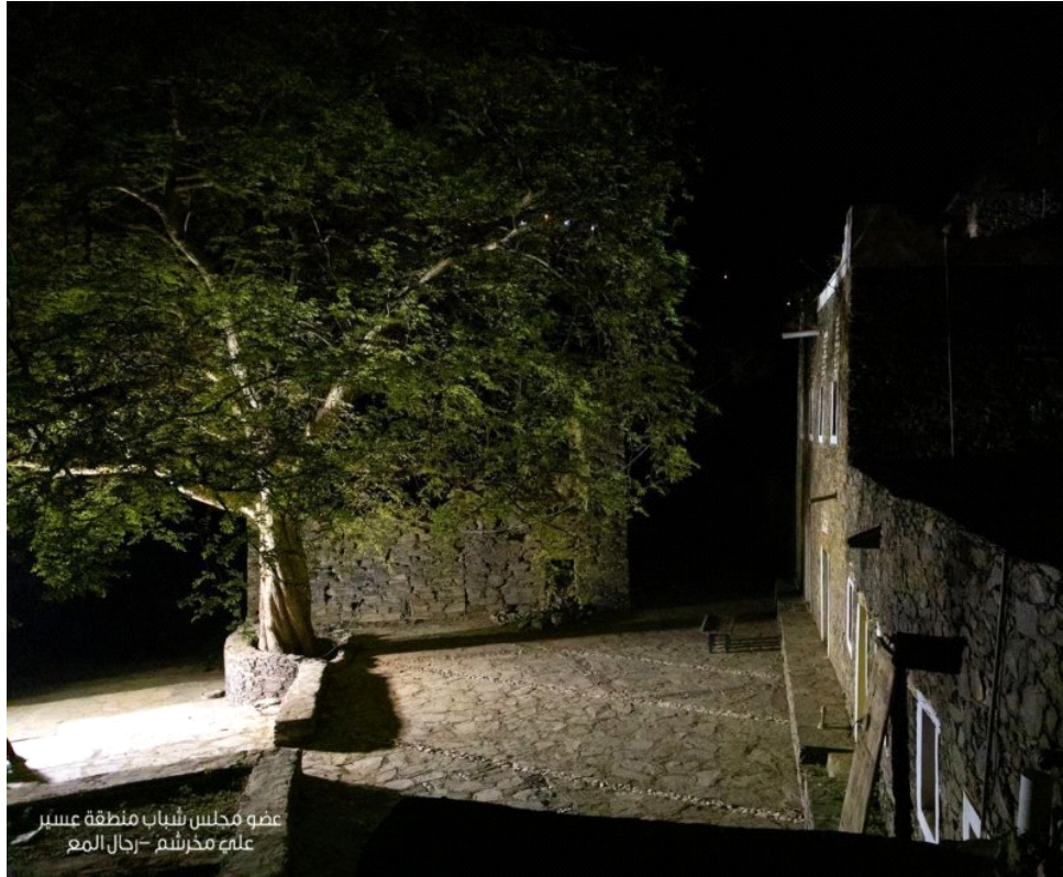
عضو مجلس شباب منطقة عسير عليه محرشم - رجال ألمع

وأكد الأمير تركي بن طلال في التوجيه: "أن من واجبات الإنسان في الأرض عمارتها وعدم الإفساد فيها، في ترابها، ومائها، ونباتها، بالتالي فإن الحفاظ عليها واجب شرعي و وطني، فهو موروث حضاري تميز به الآباء والأجداد، ويجب العودة إلى العادات الحميدة التي اتبعها الآباء في رعاية البيئة، مما يحتم على الجميع سواء المحافظين أو النواب أو رؤساء البلديات أو منظمات المجتمع المدني والمواطن ذاته السهر على رعاية تلك المقومات، وعمل كل ما يلزم لمنع العبث بها، لقوله تعالى: عَلَّ ذُرّاً لَكُمْ فِي الْأَرْضِ مُخْتَلِفًا أَلْوَانُهُ؟ إِنَّ فِيهَا لَآيَةً لِّقَوْمٍ يَذَّكَّرُونَ " (النحل ) (13).