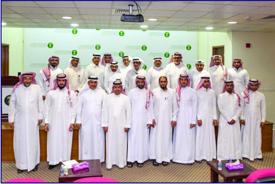
منسوبي الفرع الملتحقون بالدورة (اليوم)