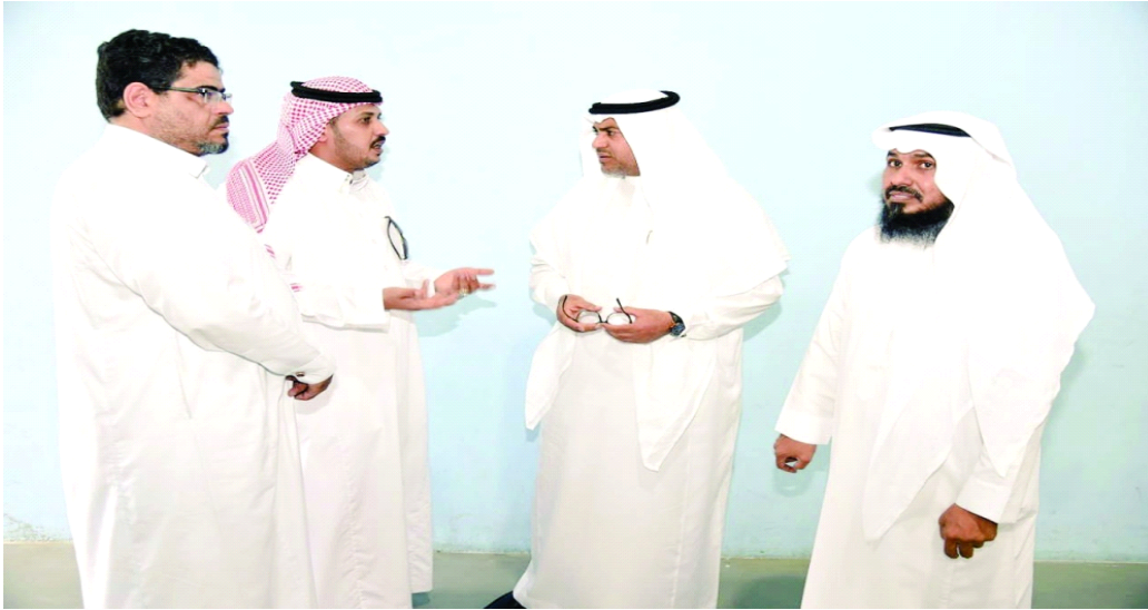
الزايدي خلال لقائه مع الأهالي