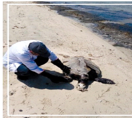
فحص السلحفاة ومعرفة أسباب نفوقها

يذكر أن هناك ثلاثة أنواع من السلاحف تعيش داخل مياه الخليج العربي «الخضراء، صقرية المنقار وكبيرة الرأس» وتنتشر السلحفاة الخضراء في الخليج العربي والبحر الأحمر، وهي ذات لون بني مخضر ومصفر من الناحية البطنية، ذات رقبة قصيرة ولديها بالفم فكوك مسننة، يبلغ طول الدرقة ??? سم، والأطراف متحورة إلى مجاديف للسباحة، وتعيش قريباً من السواحل الرملية، حيث توجد في المياه الضحلة، التي تكثر بها الحشائش والطحالب البحرية.