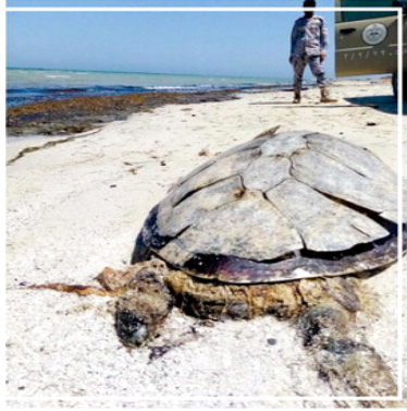
السلاحفة نافقة على شواطئ الجبيل (اليوم)