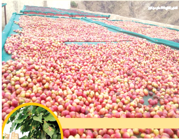
الداير تنتج 500 طن من البن

تتميز باعتدال أجوائها وهطول الأمطار الغزيرة صيفا «الداير بني مالك» درة الجنوب وحاضنة البن الخولاني